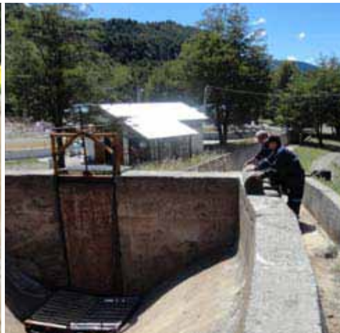
Desenrollado de los rollos de CC8