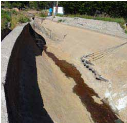
Estanque de hormigón deteriorado