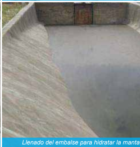
Llenado del embalse para hidratar la manta