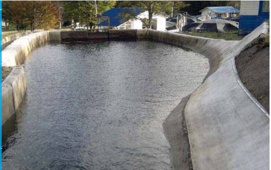
Vista del estanque reacondicionado, relleno al día siguiente a la instalación

La manta se usó para reparaciones críticas en el plazo en una piscifactoría, revisando un estanque de hormigón deteriorado y fisurado