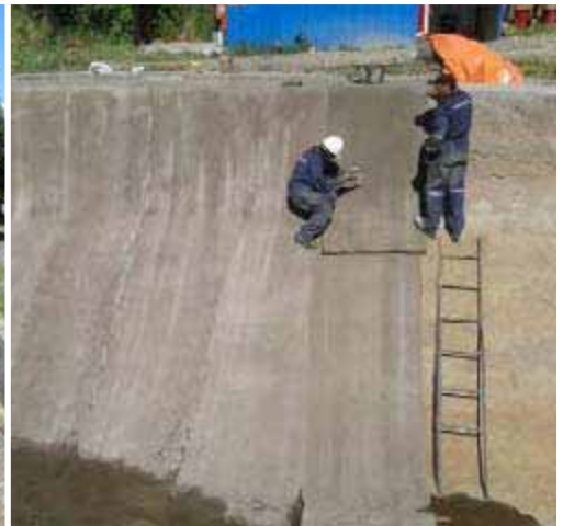
Fijación de la Manta al soporte existente