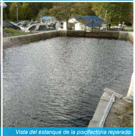
Vista del estanque de la piscifactoría reparado